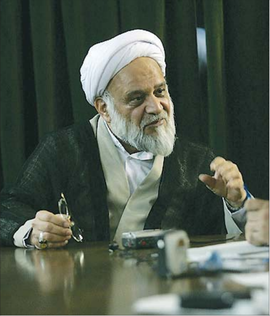
جلسه‌ی شورای عالی اقتصاد در تاسفیل، ۲۰۰۷

نیست بلکه می‌خواهیم پاره‌انه‌ها را به‌طور هدفمند توزیع کنیم. برداشت یکباره یارانه‌ها شوک سنگینی وارد می‌کند و این شوک سنگین قابل تحمل ملت‌مانخواهد بود بنابراین تبدیل به چند شوک ملایم‌تر